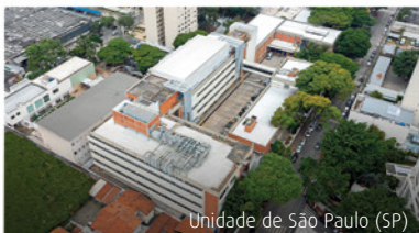
Unidade de São Paulo (SP)