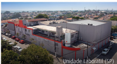
Unidade Laboratíl (SP)