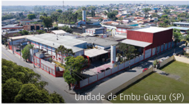
Unidade de Embu-Guaçu (SP)