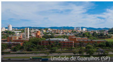
Unidade de Guarulhos (SP)