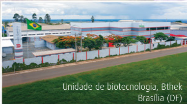
Unidade de biotecnologia, Bthek Brasília (DF)