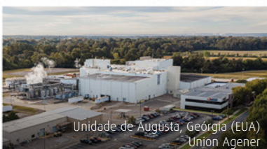
Unidade de Augusta, Geórgia (EUA) União Agener