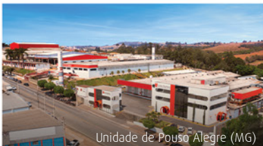
Unidade de Pouso Alegre (MG)