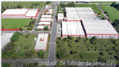
Unidade de Taboão da Serra (SP)