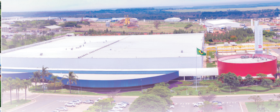
Unidade de Brasília (DF)