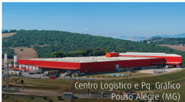
Centro Logístico e Pq. Gráfico Pouso Alegre (MG)